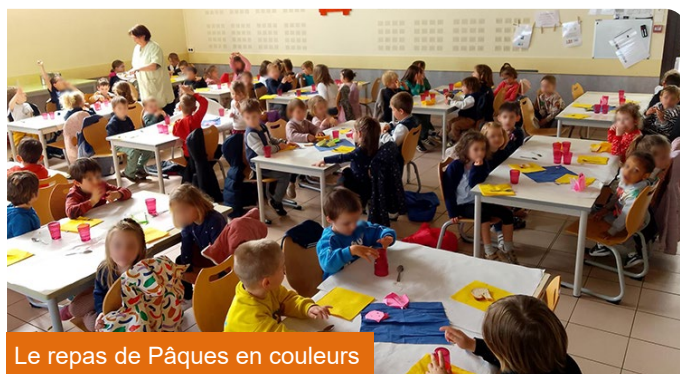
Le repas de Pâques en couleurs