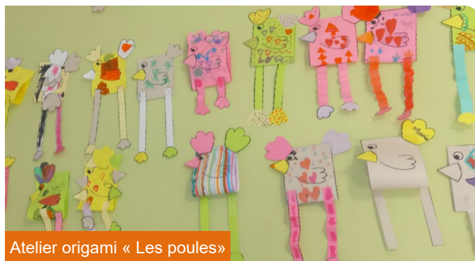
Atelier origami « Les poules »