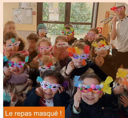
Le repas masqué !