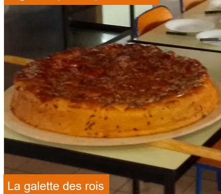
La galette des rois