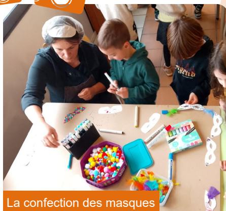
La confection des masques