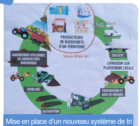
Mise en place d'un nouveau système de tri