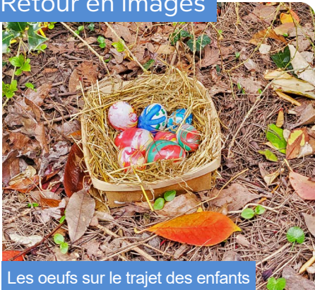
Les œufs sur le trajet des enfants