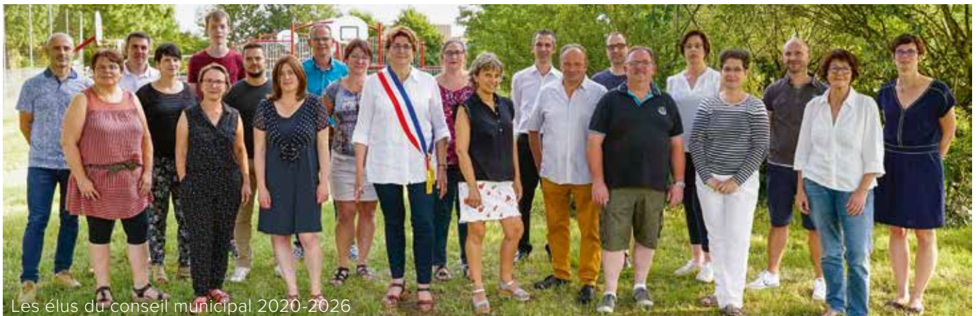
Les élus du conseil municipal 2020-2026