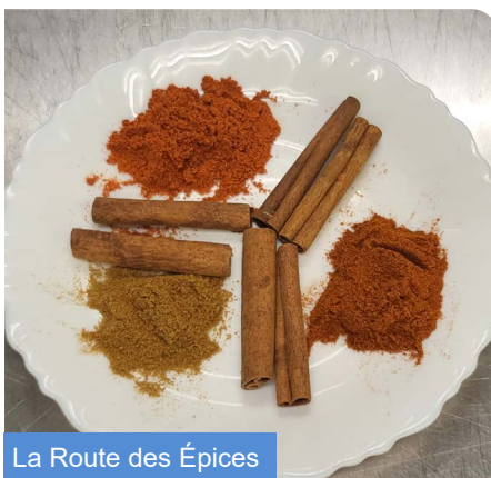
La Route des Épices