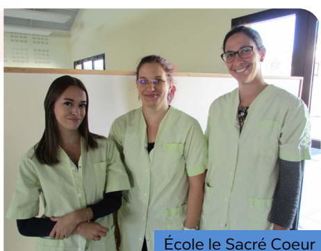
École le Sacré Coeur