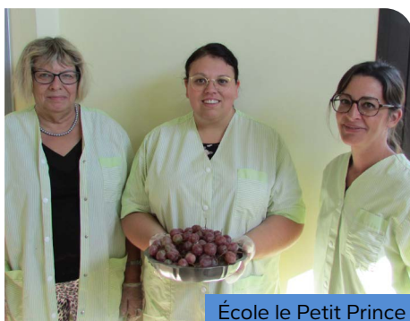
École le Petit Prince