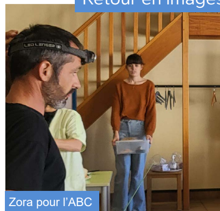
Zora pour l'ABC