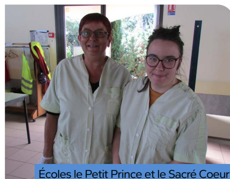
Écoles le Petit Prince et le Sacré Coeur