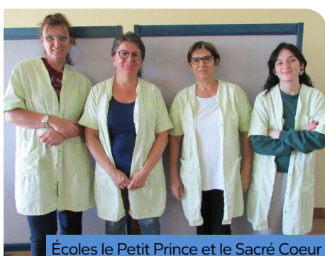
Écoles le Petit Prince et le Sacré Coeur