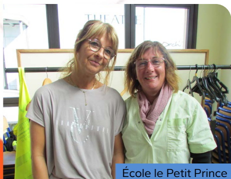
École le Petit Prince

En ce début d'année scolaire, l'équipe n'était pas au complet. Elle a donc été renforcée par les élus et les autres services municipaux (technique et administratif). Nous tenons donc à les remercier pour leur aide.